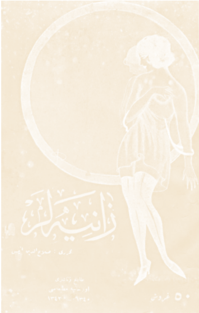
Zaniyeler'in ilk baskısının kapağı.