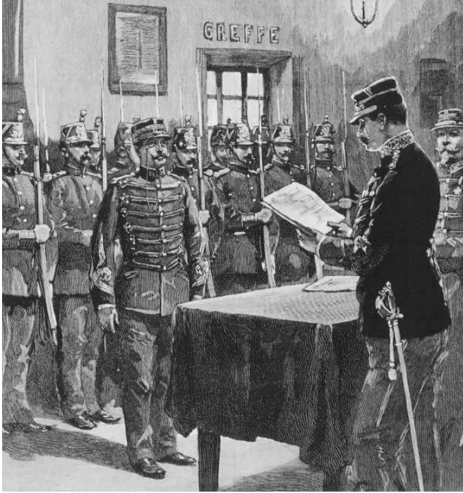
Savaş Kurulu'nun tutuklama kararı Dreyfus'ün yüzüne okunurken. Gennaro d'Amato'nun çizimi. 29 Aralık 1894.