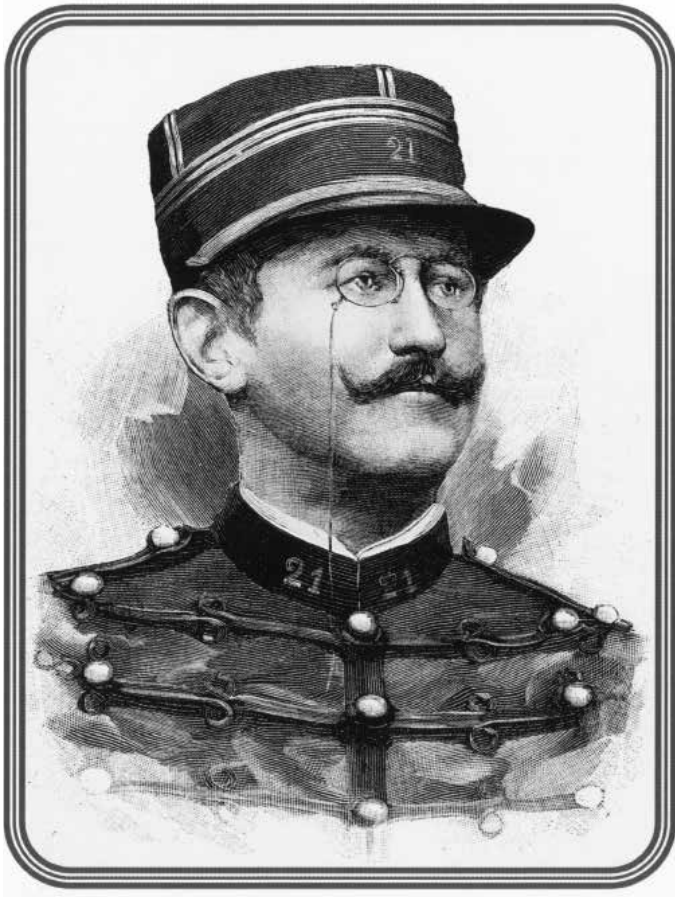
Yüzbaşı Alfred Dreyfus'ün Savaş Kurulu'nun soruşturması devam ederken çekilen fotoğrafı. 22 Aralık 1894.