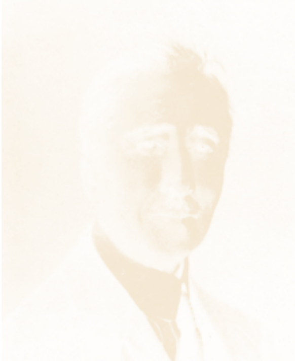
Hüseyin Rahmi Gürpınar.