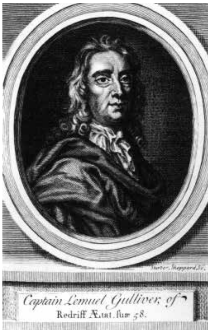
Kaptan Lemuel Gulliver'in portresi.