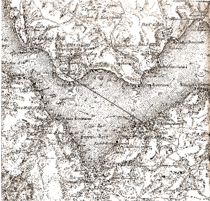
Eylül 'de Boğaziçi'ndeki olayların geçtiği Yenimahalle, Büyükdere, Tarabya gibi semtleri gösteren harita (Jean-Denis Barbié tarafından geliştirilmiş Kauffer Haritası, 1819).