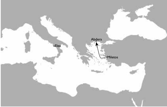
Resim 1.1. Atomcu okulun kurucusu Miletos'lu Leukippos'un yolculuğu (MÖ 450 civarı).

Eski bir öyküye göre MÖ 450 yılında bir adam Miletos'tan Abdera'ya gitmek için bir gemiye biner (resim 1.1). Bu, bilgi tarihinde çok önemli bir yolculuk olur.