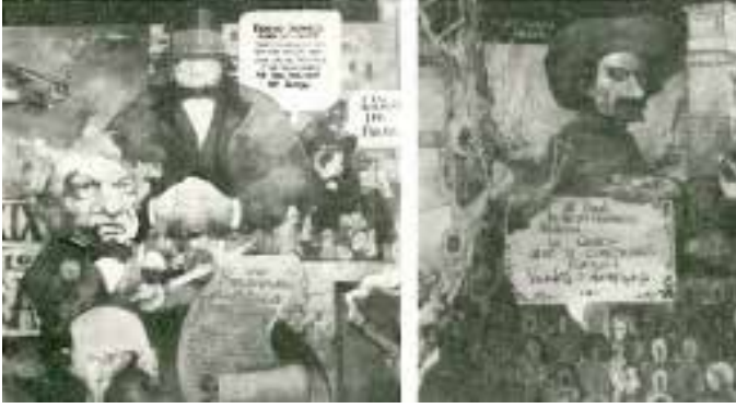
Venezuela'nın isyan tarihini anlatan dev bir duvar resminin parçaları. Sayfa 22'de büyük portre, devrime ismini veren Bolívar'a ait.

mın ağırlığı bir kitaba dönüştü. Bütün dünyaya hiç olmadıkları şekilde yansıtılmış ya da ülkeleri ve yeryüzü için yaptıklarından yeterince bahsedilmemiş bu insanlar, o kadar çok anlaşılacak ve sözlerini iletmek istiyorlardı ki böyle bir "kitabı" yazmak gerekti. Bu yüzyılın ilk devrimini yapan insanların hatırı var nihayet! Dedim ya, devrim yapmış bir halkın selamı kalmasın üzerimde. Venezuelalı yoksulların, tek tek hepinize, hepsinin selamı var size!