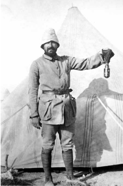
Enver Bey, Derne'deki (Libya) karargâhında.

Mektuplaşmaya başladık. Birbirimizi hiç görmemiştik. Ben onun resmini görmüştüm; onun, benim resmimi dahi görmüş olduğunu zannetmiyorum. Beni annesinin tarifi ile tanıyordu. Hayalinde beni nasıl canlandırdığını bilmiyordum. Fakat mektuplar sayesinde birbirimizi görmüş gibi sevdik. Bir sene süren bu tatlı ayrılık, bizi birbirimize yaklaştırdı.