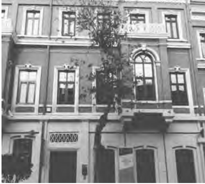
Annesi, kız kardeşi ve zaman zaman da Atatürk'ün kaldığı evin bugünkü görünüşü.

İstanbul'a gelip Beşiktaş, Akaretler Yokuşu'ndaki 76 numaralı evi kiraladılar.