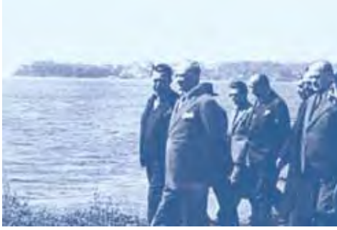
Mustafa Kemal ve Fenerbahçeli yöneticiler Moda kıyısında...