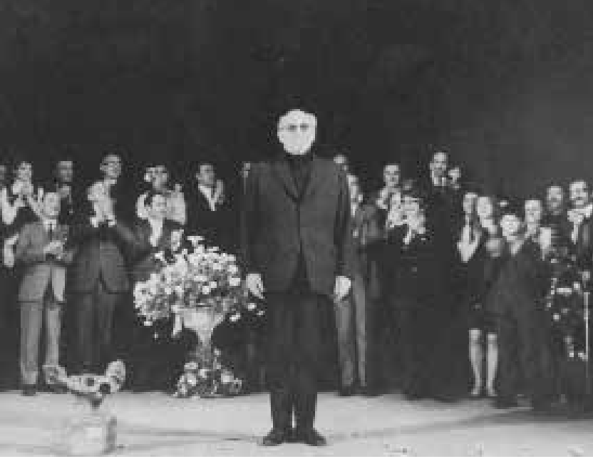
Muhsin Ertuğrul'un 60. Sanat Yılına Saygı Gecesi, 12 Ocak 1970.