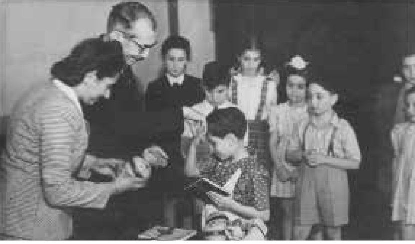
“İlkokul 1’de sınıf birincisi olunca Pál Sokağının Çocukları kitabını armağan ettiler.”

mücadeleli, heyecanlı, çok güzel bir meslek hayatı; bir mücadele dönemi... Kişiliğimi bunlar belirledi.