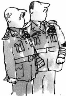
Kara ve Hava Kuvvetleri Komutanları