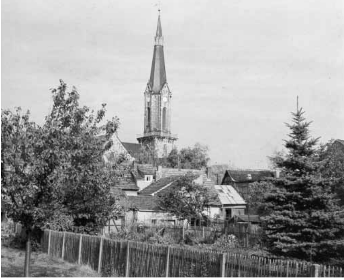
Bach ailesinin birçok üyesinin yaşadığı Wechmar kasabası.

yerleştiği sırada bırakmak zorunda kaldığı şana yeniden başlamayı neden kaldırsındı ki? Dul, çocuklarının vesa-yetini almak için bir daha evlenme niyetinde olmadığını açıkladı ve aynı zamanda “Saint-Thomas Okulu’nda, merhum Kantorların dullarının altı ay süreyle eşlerinin maaşından yararlanmaları uzun süredir bir âdet haline geldiğinden, bu Kühnau’nun dulu ve ondan önce Schelle’nin dulu ve ondan daha öncekiler gibi, benden önceki herkes için geçerli olduğundan” altı aylık maaş isteginde bulundu. Bach’ın yirmi yedi yıl önce görevine geç başladığı için haksız yere almış olduğu 21 thalers ve 21 groschens hesaptan düşüldükten sonra, bu istek kabul edildi. Leipzig yetkilileri, dula mumluklar karşılığında bir miktar tahıl ve 11 thalers 12 groschens daha verdikten sonra, “kocasından sonra görev alacak kişinin buraya gelmek istemesi durumuna karşı” evi boşaltması ricasında