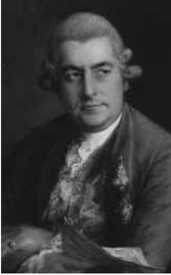
J.S. Bach'ın oğlu, besteci Johann Christian Bach.

kişisel uyumu içinde yaşıyor, ilk ya da son kelimeyi sayfanın kenarından ayıran beyaz boşluğu süslemek için üst ya da alt kısma –ama asla yanlara değil– bir bezeme çiziyordu. Evini, çocukluğundan beri oturmuş olduğu bütün evler kadar gürültülü kılmak amacıyla erkenden kalabalıklaştırmaya uğraştı ve konsantrasyonu kendi içindeki sessizliği sağlamaya yeterli olduğundan, beste yaparken bile asla yalnız kalmaktan hoşlanmadı. Gürültüler ruha hiç ulaşmazdı.