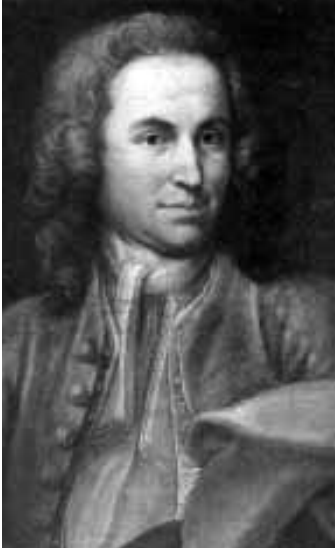
1715'te yapıldığı sanılan bir J.S. Bach portresi.