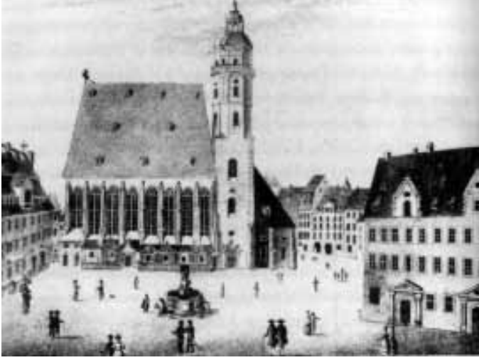
Leipzig'deki Saint-Thomas Müzik Okulu ve Kilisesi.

görünüü içinde çoğaltılan ön yüzü, bir marşın yankısının teması, bir çanın yanıtı, rüzgârın yapraklar arasındaki strettosu 1 , atların nal sesleri ve at arabasındaki tekerleklerin ritmi, konuları giden, gelen, geri gelen ve birbirine karışan bir konuşma, kiliselerdeki vitrayların saate göre değişen renkleri, kavkuların ve merdivenlerin sarmalları, kristallerin sivri köşeleri, rüzgârlı havalarda karın ya da kumun dalgalanmaları, kuru yapraklar, kütüklerin dal budak salmaları... Nesnelere ve olayların özdekliliğinden çok, bunların formlarıyla ya da imleriyle ilgileniyordu: Gerçeklik, evrenin düzenini sese dönüştüren müzik kadar mükemmel başka bir şey sunar mı?