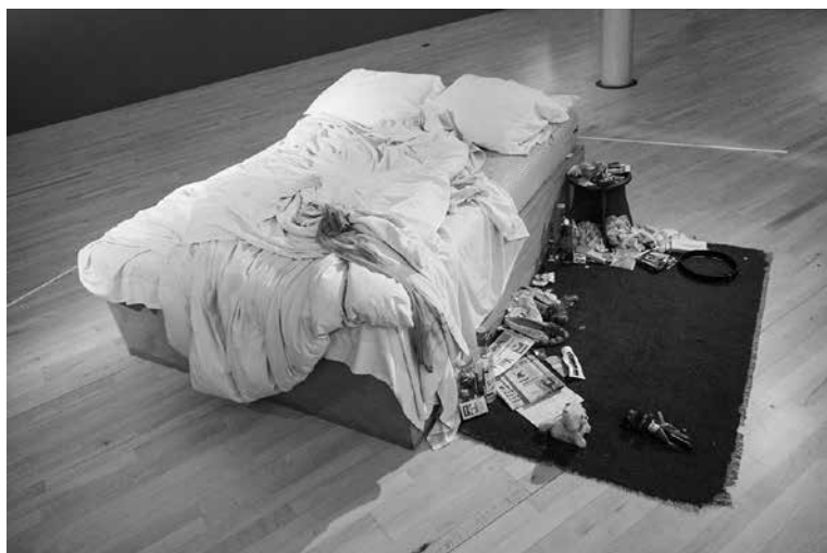
My Bed [Yatađım], Tracey Emin. Tate Modern, Londra, 1999.