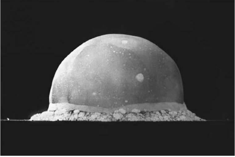
Şekil 2 Trinity, 16 Temmuz 1945'te, 0.016 saniyede test edildi. Bu resim bir süre yasaklandı; çünkü alışılmış mantar bulutundan çok daha kıskırtıcı olduğu düşünülüyordu. Ufuktaki küçük şekiller ağaçlardır. Los Alamos Ulusal Laboratuvarı.

jeofiziksel bir güç gibi davrandığı eylemlerin logaritmik artışını gösterir. 12 İnsanlar için –ve aslında radyoaktif serpinti alanındaki bütün yaşam formları için– “dünya-tarihine ait” olduğu ölçüde önemli olan bu olaylar Yerküre’ye ait en büyük devir olan jeolojik dönemin sınırlarını belirler. “Dünya tarihine ait olma”yı tırnak içinde kullanıyorum çünkü bu aslında tartışma konusu olan dünya kavramının akıbetidir. Şu anda insanların görüş alanına giren ve Yerküre’nin kendisinin de kesinlikle aralarında yer aldığı hiperneselerin saldırısının beraberinde getirdiği şey, kuşkusuz dünyanın sonudur ve bunun jeolojik döngüleri yalnızca insani olgu ve değerlere göre düşünmeyen bir jeofelsefe gerektirir.