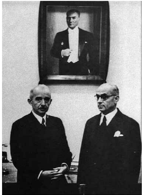
Mustafa Kemal'in son on yılına damgasını vuran İnönü-Bayar rekabetinin spor alanındaki tezahürlerinden biri de Ateş-Güneş Kulübü'nün kurulmasıydı.

Ama Atatürk'ün o dönemdeki gözdesi Celal Bayar'dı. 1932'de Bayar'ı İnönü'ye rağmen ekonomi bakanı yapmış, genç Cumhuri-