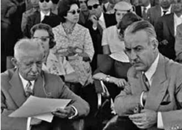
Başbakan İsmet İnönü'nün Galatasaray'daki gücü, Suat Hayri Ürgüplü'nün şahsında cisimleşiyordu.

Kulüp içi mücadelenin on yıllık bir geçmişi var... Yönetimde "eskiler" var, muhalefette ise "gençler". Muhalefet medya yoluyla yönetimi sürekli topa tutuyor. Yönetimi arka arkaya sürekli yapılan kongrelerde bunaltıyor, eleştiriyor. Öyle ki bazen yönetim bunaltıyor ve epey kalabalık bir grubu kulüp üyeliğinden topluca atacak kadar sertleşiyor.