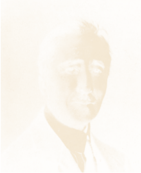
Hüseyin Rahmi Gürpınar.