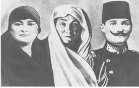
Kız kardeşi Makbule, Annesi Zübeyde Hanım ve Mustafa Kemal.

Beşiktaşlı yöneticiler ise 76 numaralı evle yakından ilgileniyor; Zübeyde Hanım'ı sık sık ziyaret ederek bir ihtiyacı olup olmadığını soruyorlardı.