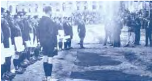
Taksim Stadı'nda... Galatasaray ve Fenerbahçe... Gazi Kupası maçının başlamasına saniyeler kala...