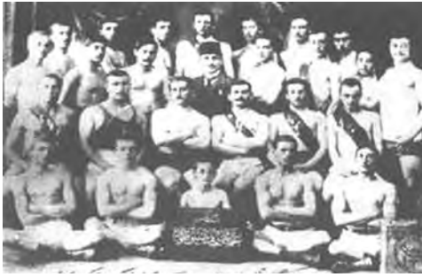
Beşiktaş Jimnastik Kulübü... İlk yıllar.

İttihat ve Terakki'nin önde gelenlerinden Mithat Şükrü'nün yazdığına göre, İttihat ve Terakki'nin bir toplantısında, konuşmacılar başarısızlıklarını artan baskılara bağlayınca kalkıp bir konuşma yapan Atatürk, Beşiktaş'ı örnek göstererek: