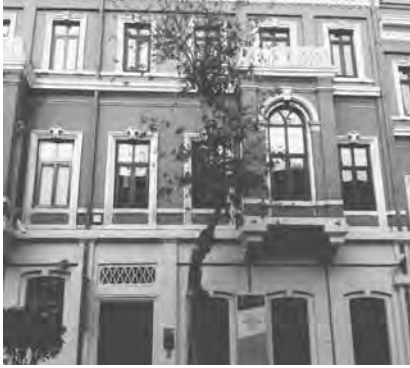
Annesi, kız kardeşi ve zaman zaman da Atatürk'ün kaldığı evin bugünkü görünüşü.

İstanbul'a gelip Beşiktaş, Akaretler Yokuşu'ndaki 76 numaralı evi kiraladılar.