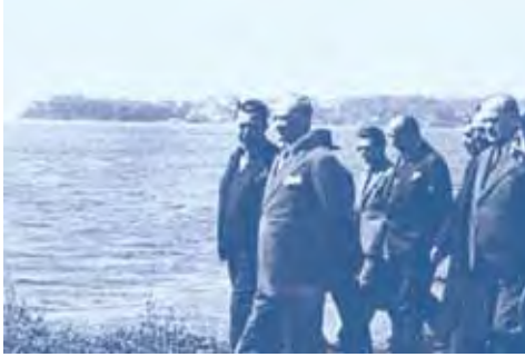
Mustafa Kemal ve Fenerbahçeli yöneticiler Moda kıyısında...