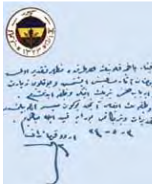
Mustafa Kemal'in Fenerbahçe'yi ziyaretinde anı defterine yazdığı...

3 Mayıs 1918 tarihinde, bu tür ziyaretlerden birini de Fenerbahçe Kulübü'ne yaptı. Kulübün Kuşdili Lokali'ne, Fenerbahçe'nin o zamanki başkanı ve aynı zamanda yakın arkadaşı Sabri Bey'le gelen Atatürk önce bir yorgunluk kahvesi içti. Sonra kupaların ser-