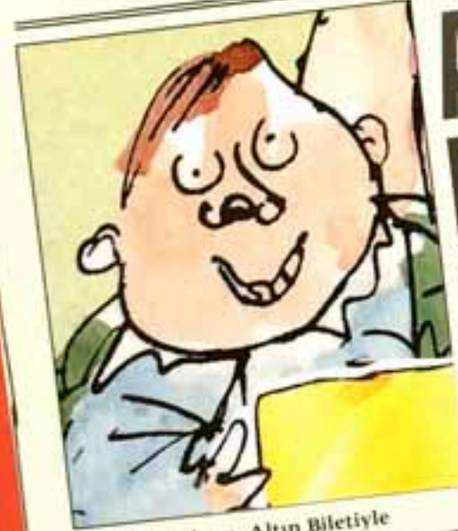
Augustus Gloop, Altın Biletiyle