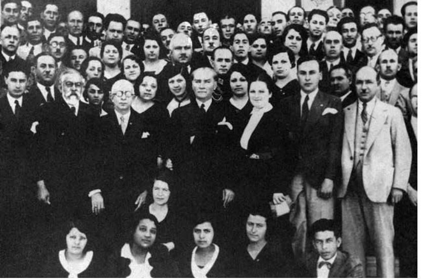
Atatürk, 1. Türk Tarih Kongresi'ne katılanlarla, 9 Temmuz 1932.