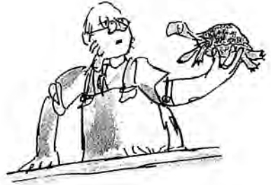
Hayvan dükkânı sahibi