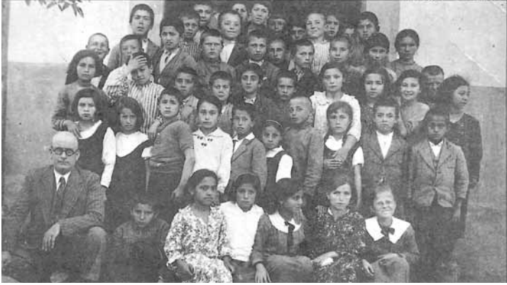
Adalet Aġaoġlu, önden ikinci sırada sağdan üçüncü.